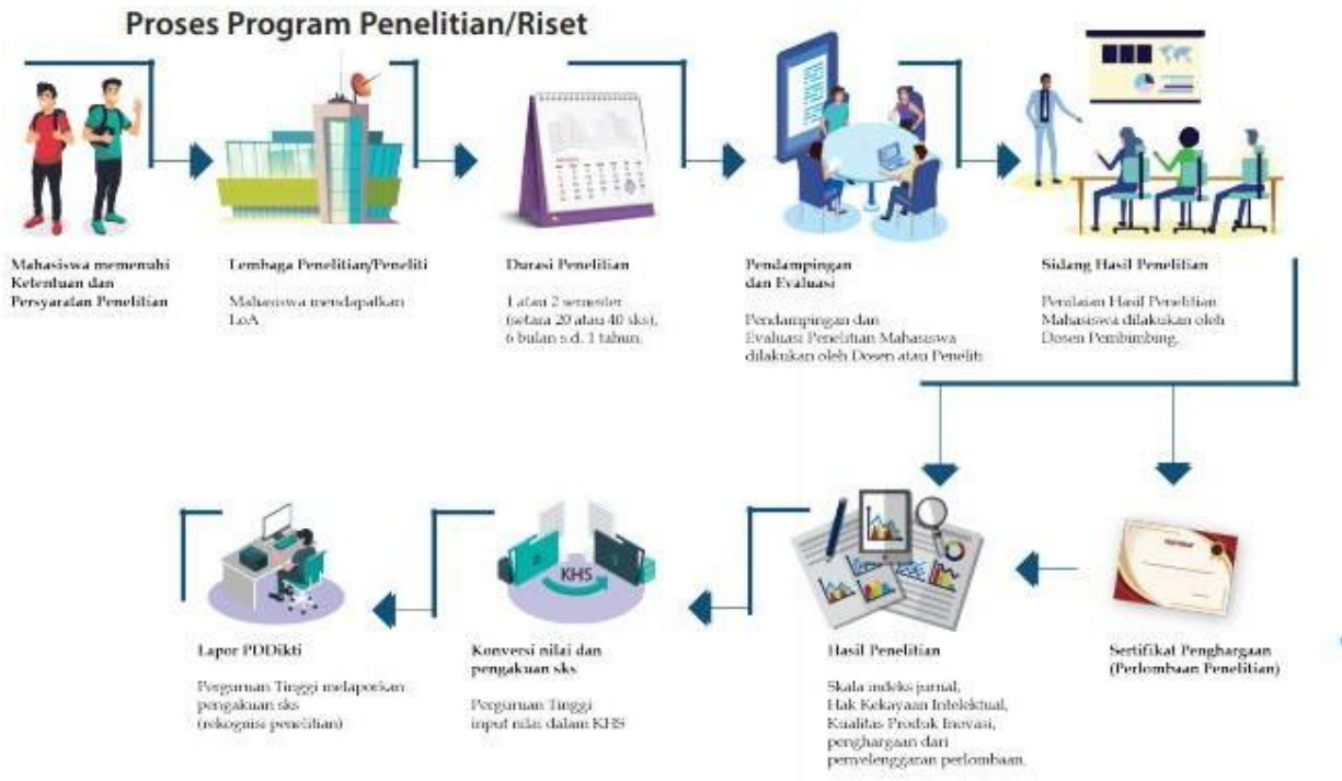
Diagram Alur Proses MBKM Skema Penelitian